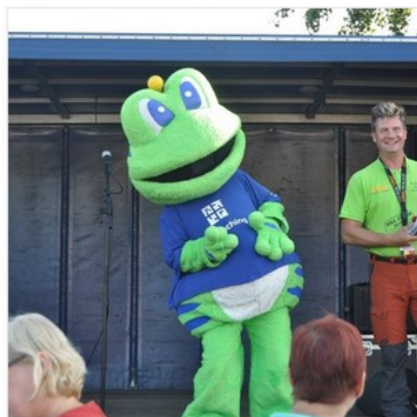
Galerij - Welcome To Belgium 2019 - Geonews

Volg Geonews op Facebook en mis geen enkel nieuwje!